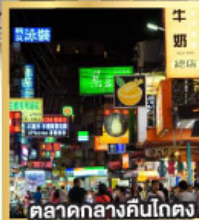
ตลาดกลางคืนโตง