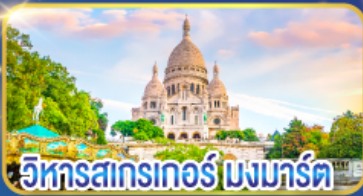
วิหารสตรกเกอร์ มงมาร์ต