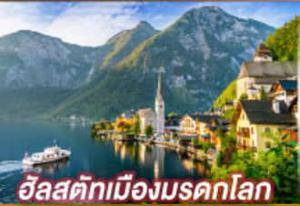
อิลสติกเมืองมรดกโลก