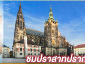
ชมปราสาทปราก