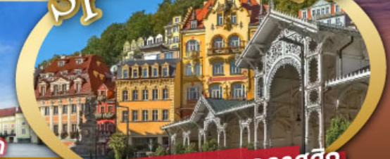
ชมสถาปัตยกรรมคลาสสิก เมือง คาร์โลวี วารี