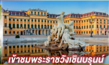
เข้าชมพระราชวังฮินบรุนน์