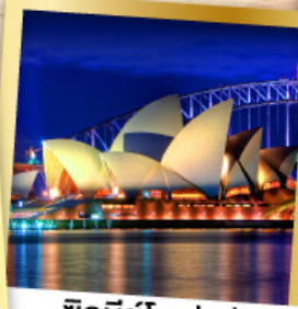
ซิดนีย์โอเปร่า