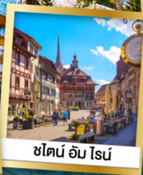
ชไตน์ อัม โรน์