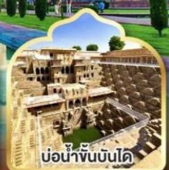
บ่อน้ำจันทันโด