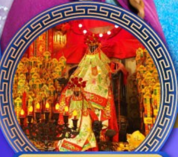
เจ้าแม่กวนอิมฮ่องกง