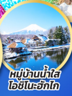
หมู่บ้านน้ำใส ไอชิโนะอัทสึ