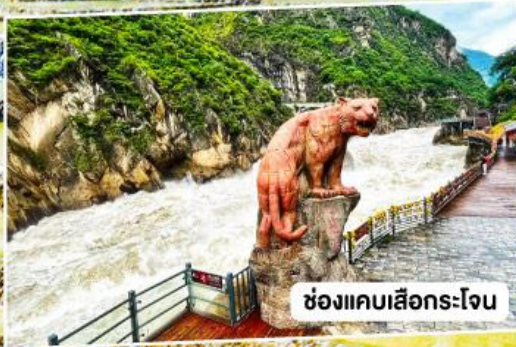
ช่องแคบลีเจียง