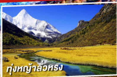
ทุ่งหญ้าลิวหนิง