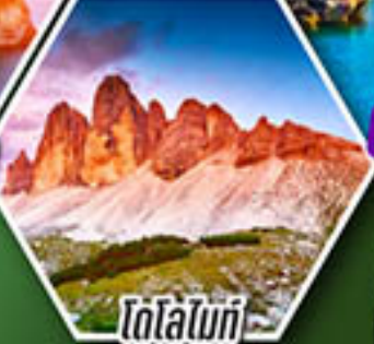
โตโลโมที

โปรแกรมเดียว เก็บครบจบ อิตาลี ตั้งแต่เหนือถึงใต้