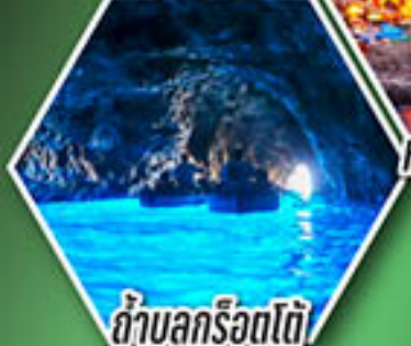
ถ้ำลูกรोटโต้