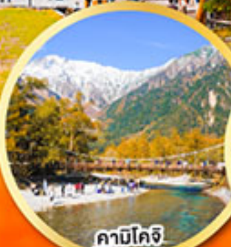
คามิโคจิ