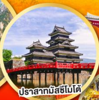
ปราสาทมัสซึโมโด้