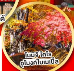
โมมิจิโคโร อุโมงค์ใบเมเปิ้ล

เที่ยวเต็มทุกวัน ไม่มีฟรีคีย์ พักออนเซ็น 2 คืน พักโตเกียว 1 คืน บินเข้านาโกย่า-ออกโตเกียว