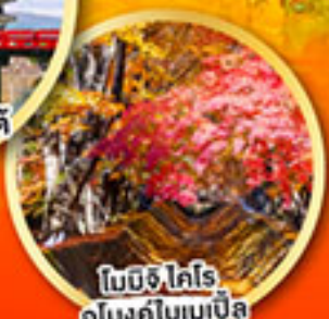
โมมิจิ ไคโร อุโมงค์ไบเมเปิล

เที่ยวเต็มทุกวัน ไม่มีฟรีใคร พักออนเซ็น 2 คืน พักโตเกียว 1 คืน บินเจ้านาโกย่า-ออกโตเกียว