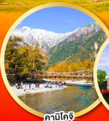
คามิโคจิ