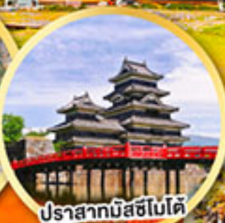
ปราสาทมัสชิโมโด้