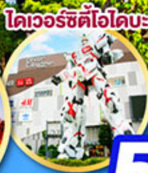
โดเวอร์ซิตีโอโดบะ