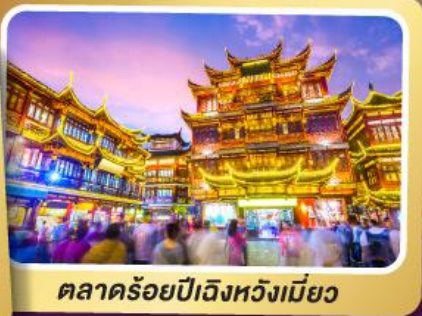
ตลาดร้อยปีเวียงหวังเมี่ยว

สนุกสนานมันส์ไปกับเครื่องเล่น Shanghai Disneyland เต็มวัน