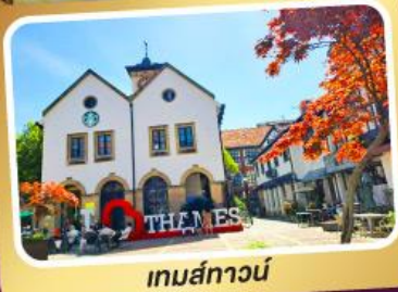
เทมส์ทาวน์