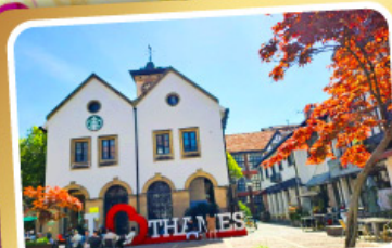
เทมส์ทาวน์