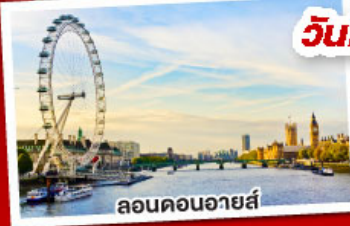
ลอนดอนอายส์