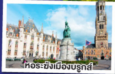
หอระฆังเมืองบรูกส์