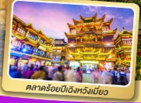
ตลาดร้อยปีดิ้งหวงเมี่ยว