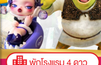
พักรักษา 4 ดาว