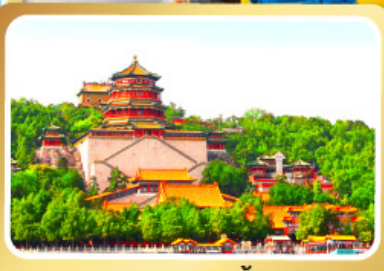
พระราชวังฤดูร้อนอ้าเหอหยวน