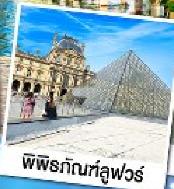
พีพีรภัทท์ลูฟวร์