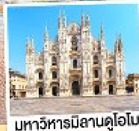
มหาวิหารมิลานดูโอโม

เมนูพิเศษ! หอยเอสคาโก้ อาหารไทย, ฟองดูชีส