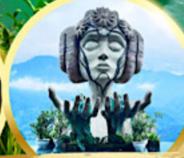
โมนาน่า ซาปา คาเฟ่