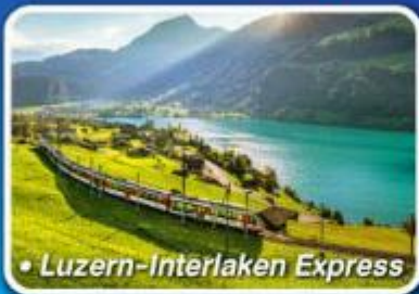
• Luzern-Interlaken Express