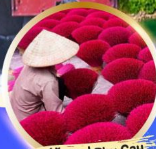
หมู่บ้านรูป Phu Cau