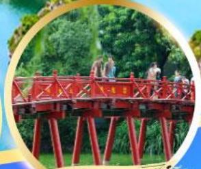
สะพานแสงอาทิตย์