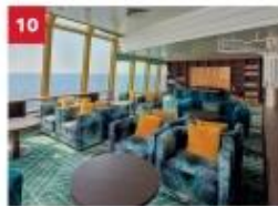
Palm Court Relax in our sophisticated observatory lounge as you enjoy sweeping ocean views.