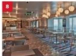
Mozzarella Ristorante & Pizzeria For adventurous foodies, savour a modern fusion of classic Italian dishes and pizzas with a Japanese twist.