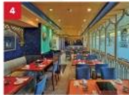
Hot Pot Enjoy your favourite noodles with an extensive list of beverages available to complement your dinner.