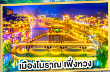
เมืองโบราณเพิ่งหวง