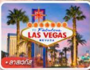
ลาสเวกัส