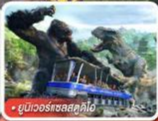
ยูนิเวอร์แซลสตูดิโอ