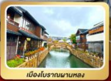
เมืองโบราณผานหลง