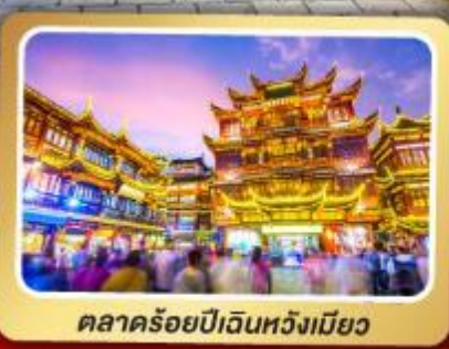
ตลาดร้อยปีเงินหวังเมียว