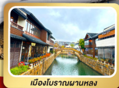
เมืองโบราณผานหลง