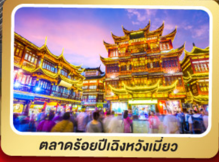
ตลาดร้อยปีเฉิงหวังเหมียว