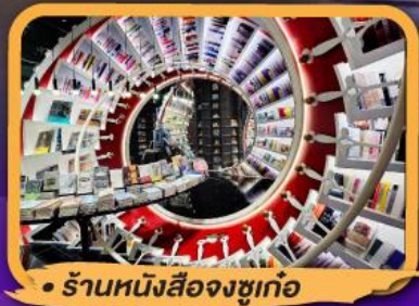
• ร้านหนังสือจุงชูก่อ