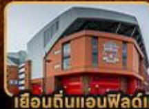
เยือนต้นแอนฟิลด์และโอลด์แทรฟฟอร์ด

London Stonehenge Liverpool Manchester Stratford Upon Avon