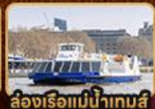
สองเรือแม่น้ำเทมส์