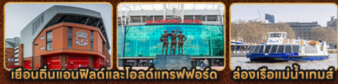
เยือนดินแอนฟิลด์และโอลด์แทรฟฟอร์ด ล่องเรือแม่น้ำเทมส์

London Stonehenge Liverpool Manchester Stratford Upon Avon