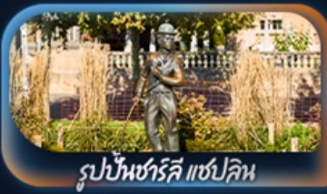
รูปปั้นชาร์ลี แชปลิน