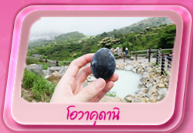
โอะวาคุดานิ

พรมสีชมพูผืนใหญ่ที่ฐานฟูจิซัง! เทศกาลชิบะซากุระ: 1 ปีมีครั้งเดียว เปิดประสบการณ์ล่องเรือโจรสลัด ตะลุยหุบเขาโอะวาคุดานิ ซิมโซ่คำ "Unseen" ขอพรด้วยหัวโชน์เก่า ที่วัดมิตสึสึยาม่า โซเค็น ช้อปปิ้งจัดเต็มย่านดงชินจูกุ และ Gotemba Outlet