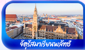
จัตุรัสมาเรียนพลาทซ์