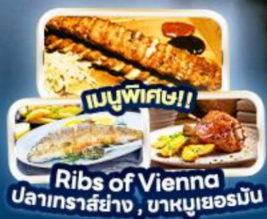
เมนูพิเศษ!! Ribs of Vienna ปลาเทราสย่าง, ขาหมูเยอรมัน