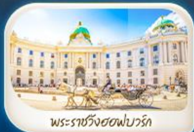
พระราชวังฮอฟบวร์ก

เดินทาง 12-18 มี.ค.68 / 19-25 มี.ค.68 28 เม.ย. - 4 พ.ค.68 7-13 พ.ค.68