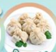
เกี้ยวจอร์เจีย Khinkali