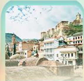
อะบาโนตูปานี