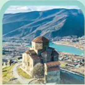
มณฑิวนารจวารี