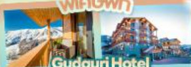
Gudauri Hotel วิวเทือกเขาคอเคซัส