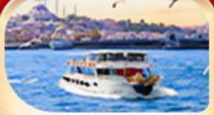
ช่องแคบบอสฟอรัส