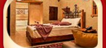
คัปปาโดเกีย