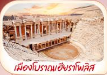
เมืองโบราณเฮียราโพลิส