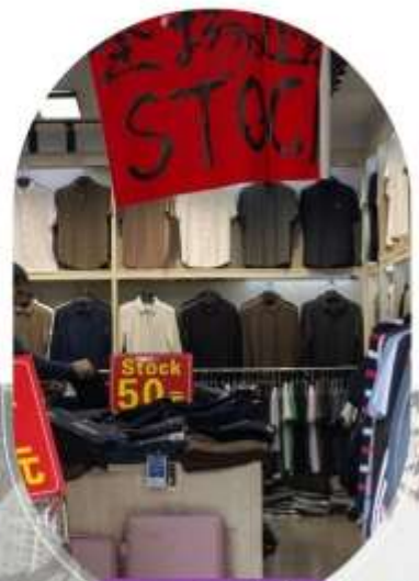
ตลาดค้าส่งอู่