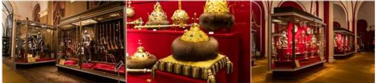
ผู้ครองเมือง ทุกพระองค์ จนกระทั่งยุคของซาร์ปีเตอร์มหาราชทรงย้ายไปเซนต์ปี