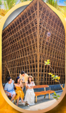
อาคารไม้ไฟ