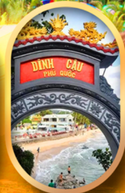
ศาลเจ้าติงเกา