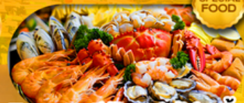
พิเศษเมนู ซีฟู้ดบุฟเฟ่ต์ 1 มื้อ เดินทาง มีนาคม 2569