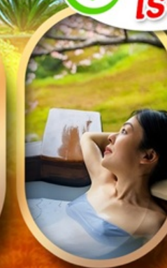
แช่บ่อนอนเซ็นญี่ปุ่น