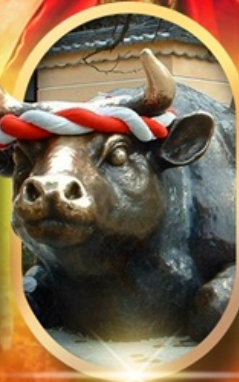
ศาลเจ้าดาไซฟู