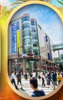
ช้อปปิ้งย่านเท็นจิน