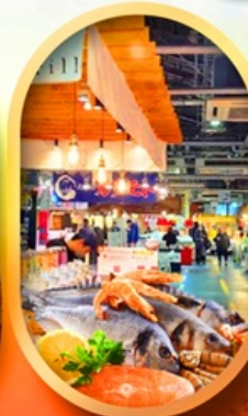
ตลาดปลานิวโตะ