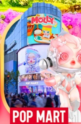
ช้อปปิ้งถนนหนางจิง