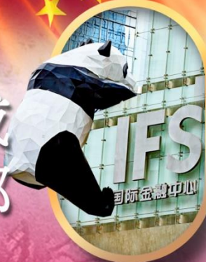
IFS หนีแพนด้าป็นตึก