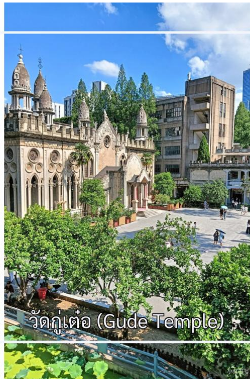
วัดกุ่เต้อ (Gude Temple)