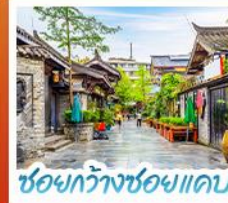
ชองกวางชองแคบ