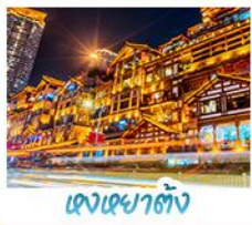
เฉิงเต๋อตัง

อุทยานหลุมฟ้า สะพานสวรรค์ • อุทยานเขานางฟ้า • หงหยาดัง • ดิกฟูยชิ่ง ชั้น 22 • วัดต้าอือ ชมรถไฟ-สุดึก • สะพานโบราณหนามเอี้ยว • เมืองโบราณกวนเซี่ยน • อุทยานภูเขาสี่ดรุณี อุทยานต้ากู่ปิงชว่น • จุดชมวิวหยางเกี้ยนหู่ • รูปปั้นหมี่แพนต้าบอมเซอเฟ้ • ร้านหนังสือจงซูเทอ ถนนคนเดินซุนซีอู่ • หมี่แพนต้าปิ่นตึก IFS • ถนนไถ่กู่หลี่ • ถนนโบราณชอยกวางชอยเคอ