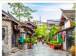
ชอยกว้างชอยแคบ