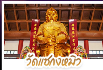
วัดเซกงเมียว