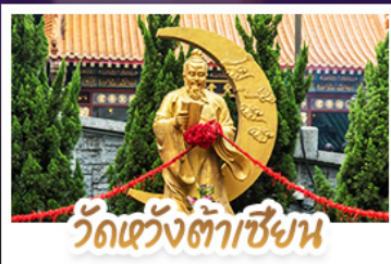
วัดแวงต้าเซียน