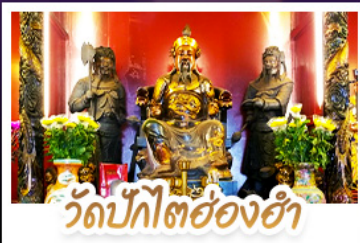
วัดปุกไต่ฮงฮ่า

นั่งกระเช้าแองปิงสักการะพระใหญ่เทียนถาน • ขอพรองค์เซกง โชคลาก การเงินและธุรกิจ เทพเจ้าปึกไต่ฮงฮ่า ขอพรเรื่องความสำเร็จในชีวิตและการทำงาน • วัดหวังต้าเซียน สักการะสิ่งศักดิ์สิทธิ์ เสริมมงคลชีวิต • เจ้าแม่กวนอิมฮงฮ่า ขอเรื่องเงิน ทรัพย์สิน และความมั่งคั่ง • อิศระท่องเที่ยว 2 วัน เลือกซื้อบัตรคัสสิ่นี่แพลนคหรือซ้อปเซ็กๆ