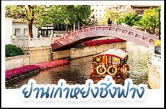
ย่านท่าฮองซิงฟาง