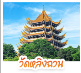
วัดเล็งฉนวน