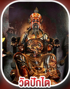
วัดปิกไค