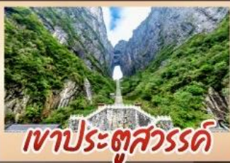
เขาประตูล้ำเลิศ