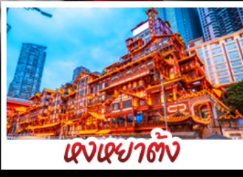
ตงเฉยตัง