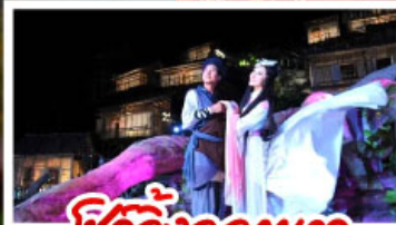
เซว้จี้จกหวา